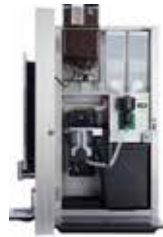
OPTIBEAN 3 (XL)