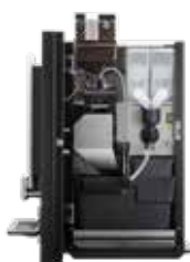
OPTIBEAN 3 (XL) TOUCH