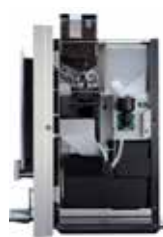
OPTIBEAN 2 (XL)